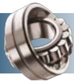
Roulements et produits de transmission de puissance