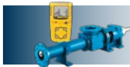
Équipements de procédés