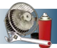
Outillage et fournitures industrielles