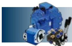
Composants et systèmes hydrauliques