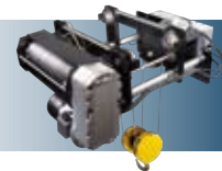
Produits de levage