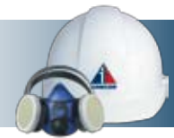
Équipements de sécurité et de protection individuelle